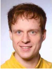
Kantor Georg Wagner